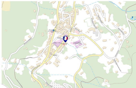
France services Vialas