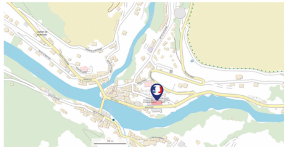
France services Pont de Montvert